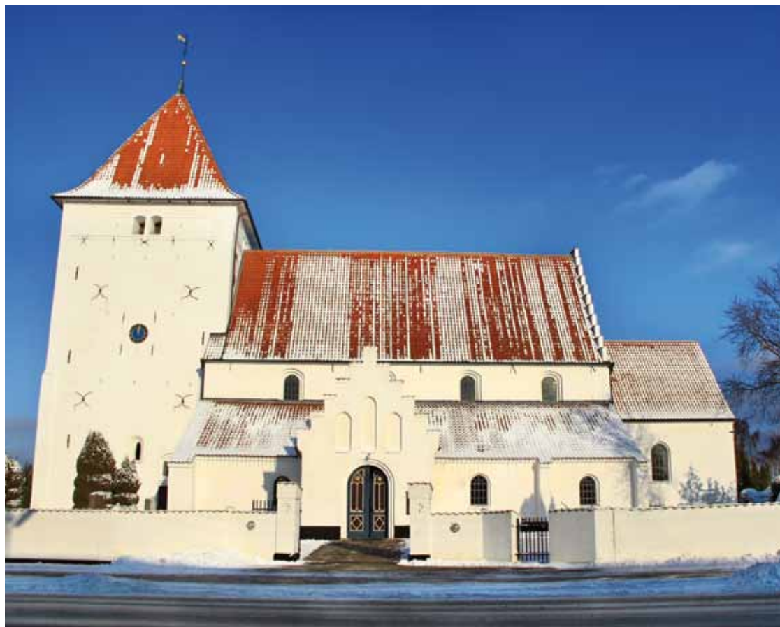
Toreby Kirke.

65. ÅRGANG NR. 1 DECEMBER 2011 - JANUAR - FEBRUAR 2012