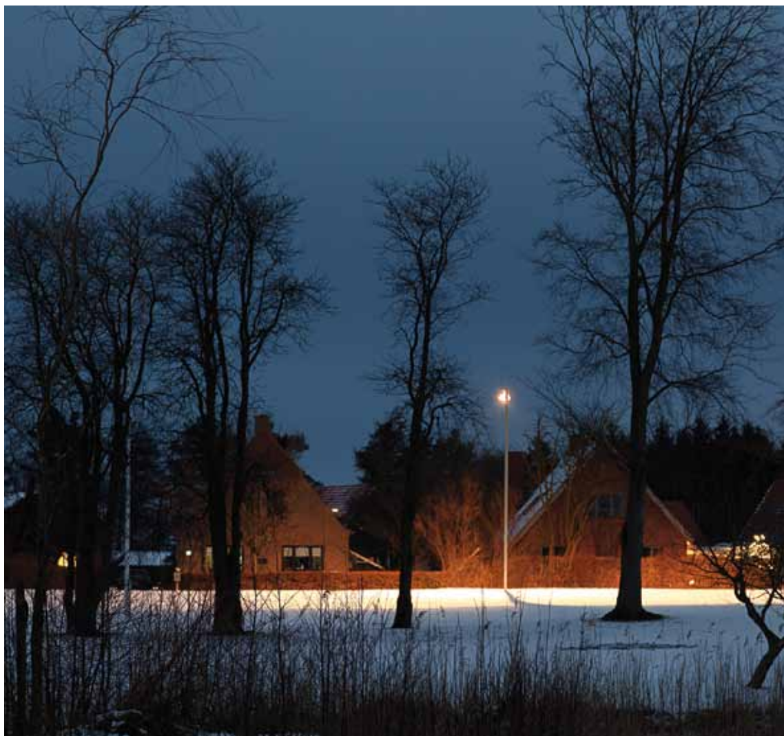
Vinter i Toreby.

66. ÅRGANG NR. 1 - DECEMBER 2012 - JANUAR - FEBRUAR 2013