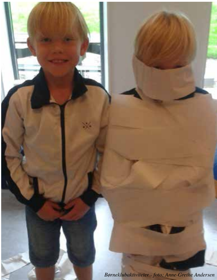
Børneklubaktiviteter - foto: Anne-Grethe Andersen

Gudstjeneste og mad er ikke kun for børnefamilier. Alle aldre er velkomne og alle kan være med.