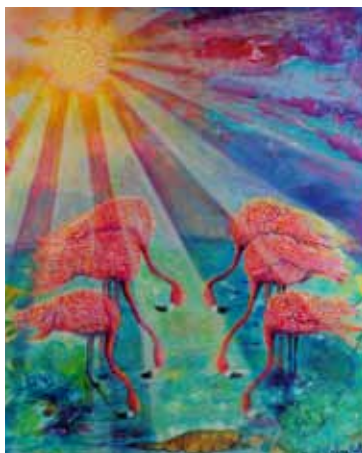
Billede til kvindernes bededag, af Chantal E. Y. Bethel

Bededagen fejres fredag den 6. marts kl. 15 , hvor vi drikker kaffe i Nordresalen. Kl. 16 er der gudstjeneste ved Lill Arndt Hemmingsen i Nordre Kirke, Nyk. F. Her samles kvinder fra alle kirkesamfund til gudstjeneste under temaet: "Ved du, hvad jeg har gjort for dig?" I år er der fokus på kvinder fra Bahamas. Se www.kvindebededag.dk