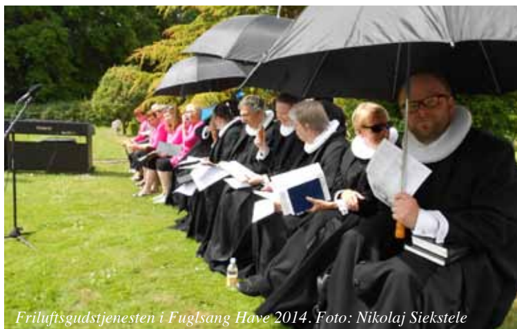
Friluftsgudstjenesten i Fuglsang Have 2014.