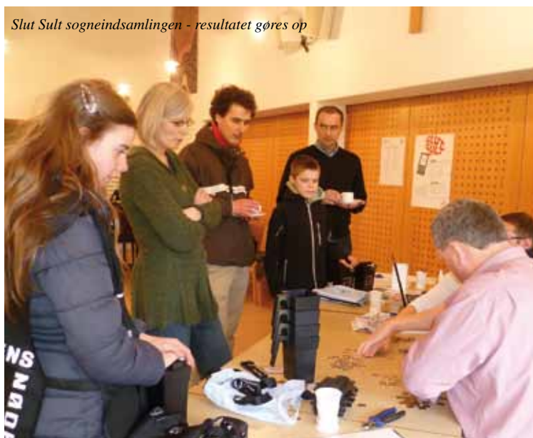
Slut Sult sogneindsamlingen - resultatet gøres op

Indleveres der mere end én valgliste udløser det menighedsrådsvalg (afstemningsvalg) tirsdag 13. november – orientering herom via sognets hjemmeside og pressen.