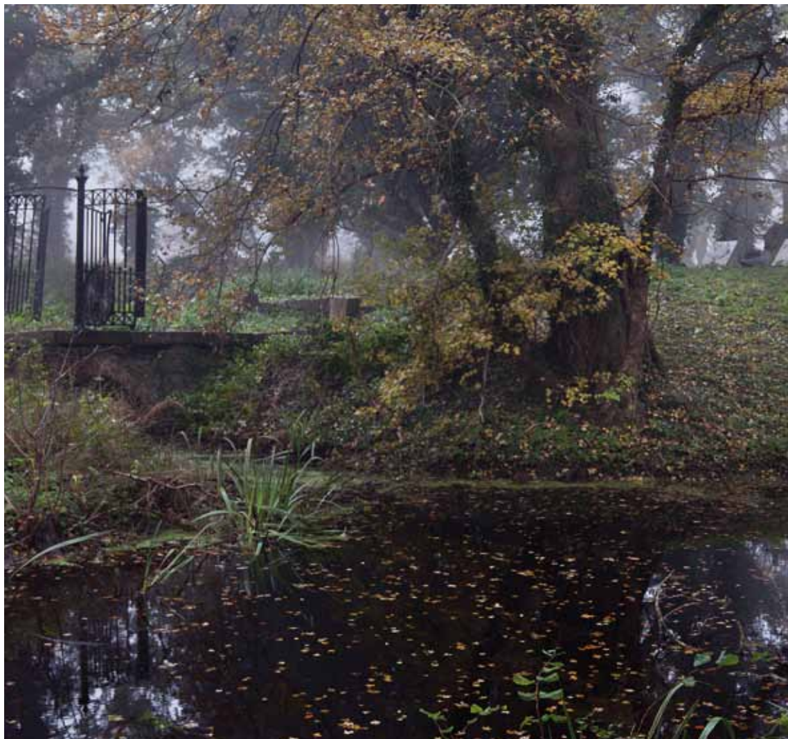
Gravpladsen på Gammelholm ved Fuglsang.

65. ÅRGANG NR. 4 - SEPTEMBER - OKTOBER - NOVEMBER 2012