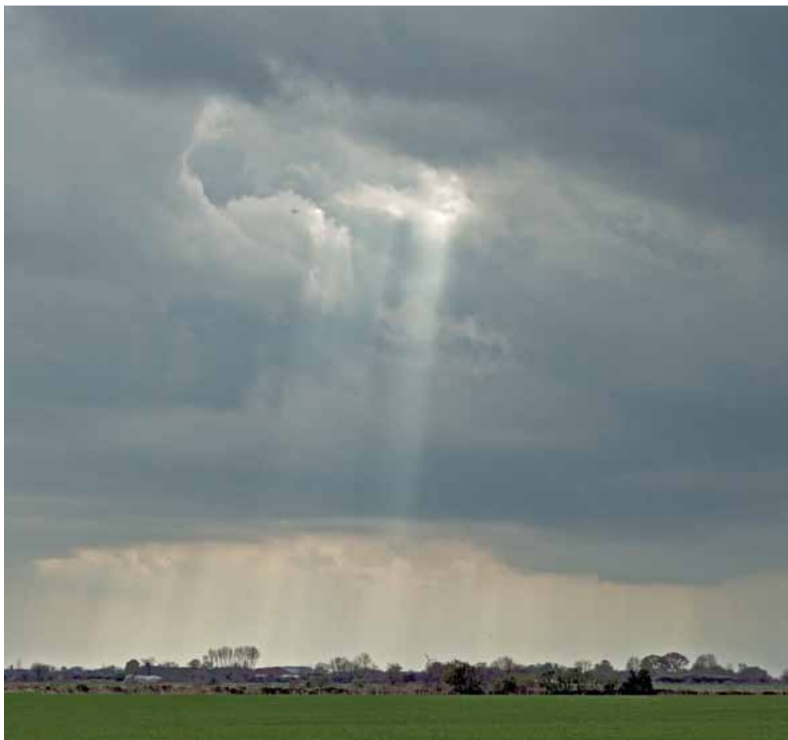
Himmelsk lys over Toreby Sogn.

66. ÅRGANG NR. 2 - MARTS - APRIL - MAJ 2013