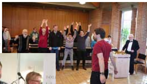
GLAD gudstjeneste i Lindeskovkirken